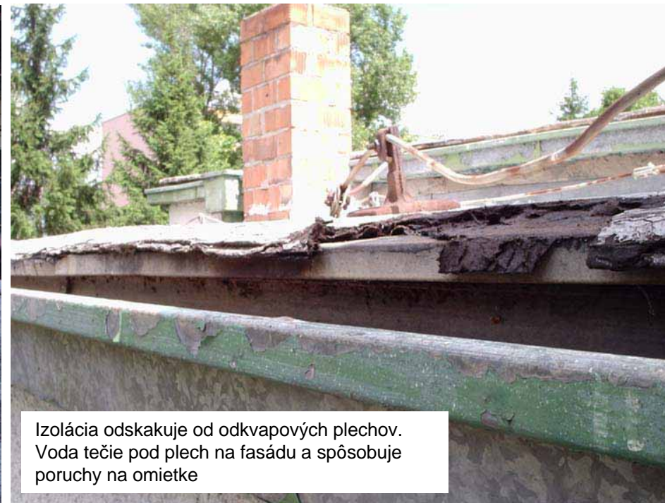
Izolácia odskakuje od odkvapových plechov. Voda tečie pod plech na fasádu a spôsobuje poruchy na omietke