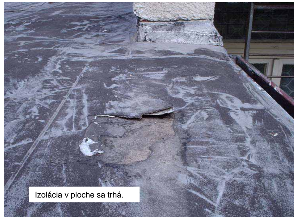
Izolácia v ploche sa trhá.